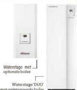
Waterstage met optionele boiler

14 GENERAL warmtepompen gemeten en vergeleken met gas en mazout.