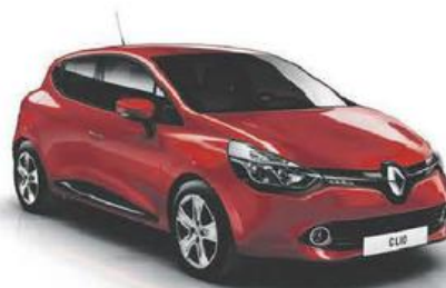
NIEUWE CLIO Authentique 1.2 16V

AAN DE UITZONDERLIJKE PRIJS VAN € 8.750 BTWi