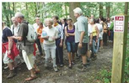
Toeristen komen graag wandelen in het eeuwenoude Pajotse landschap.

De zeven gemeenten van het Pajotse Lead-ergebied, namelijk Bever, Galmaarden, Gooik, Herne, Lennik, Pepingen en Roosdaal besloten om samen te werken op gebied van zachte recreatie en toerisme. Hiervoor vertrekken ze van wat hen het meeste bindt op recreatief gebied, namelijk het open en groene landschap. De beleving in dat landschap is een grote troef voor de zeven gemeenten.