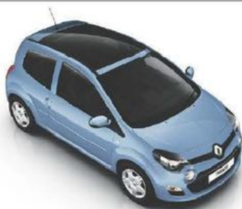
BEPERKTE SERIE TWINGO HELIOS LEv 75 PANORAMISCH GLAZEN OPEN DAK

AAN DE UITZONDERLIJKE PRIJS VAN € 8.750 BTWi