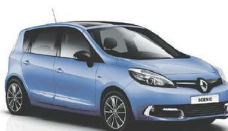
NIEUWE SCÉNIC Expression 1.6 16V 110