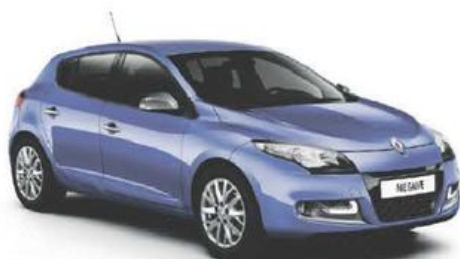
BEPERKTE SERIE MÉGANE BERLINE SPORT-LINE 1.6 16V 110 EEN SUPERUITGERUST REFERENTIEMODEL

VANAF (KORTING EN PREMIE INBEGREPEN) € 10.950 BTWi