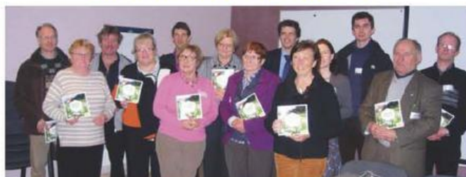
Gemeenten steunen campagne Boeren met Klassen van de provincie Vlaams-Brabant

Nu gemeente- en provinciebesturen aan hun nieuwe bewindsperiode zijn begonnen, worden ook de lijnen van het beleid naar voor geschoven. Niettegenstaande Vlaams-Brabant voor een groot gedeelte rond de Europese hoofdstad ligt, telt onze provincie toch 41 procent landbouwgrond. Land- en tuinbouw vormen in Vlaams-Brabant een belangrijke economische sector, en dit wil het provinciebestuur zo houden. De inzet van kennis en het nieuwe landbouwloket moeten zowel de sector als de gemeentebesturen ondersteunen. Vlaams-Brabant vermarkt haar landbouw de komende zes jaar onder de noemer 'boeren met klasse'.